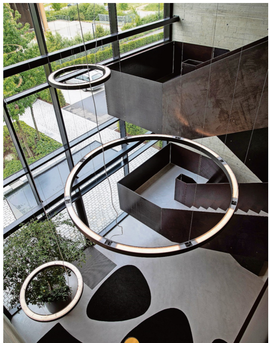
Modern gestaltetes Treppenhaus

Zu nennen wäre auch der Neubau des Funktionsgebäudes für die Profifußballer des SSV Jahn Regensburg samt Freianlagen. Auch hier war man als Generalplaner engagiert. Es handelt sich um ein sehr modernes, qualitativ hochwertiges Gebäude mit technisch hochwertig ausgestatteten Räumen (unter anderem Fitnessraum, Entspannungsraum, Konferenzraum), welches allen Anforderungen des Profifußballs genügt.