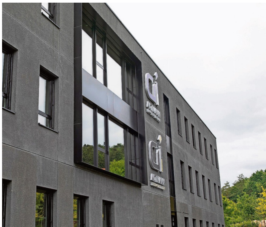
Zwei Firmen in einem Haus