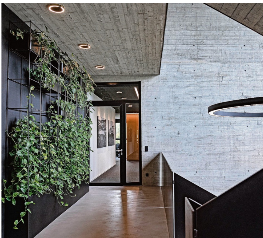
Die Natur hat ihren Platz im Gebäude.

kaufen möchte oder eine Immobilie zur Vermietung oder zum Verkauf darauf entwickeln möchte, der ist bei Altmann Immobilien an der richtigen Adresse. Gemeinsam mit dem Ingenieurbüro entwickelt man die geeignete Immobilie für das Grundstück von den ersten bautechnischen Untersuchungen über dafür erforderliche Genehmigungen bis zur Schlüsselübergabe an Mieter und Käufer. Schwierige Fälle werden gerne angenommen. Auch wer eine Wohnung mieten oder eine Gewerbefläche mieten möchte, kann sich an Altmann Immobilien wenden. Dies gilt natürlich auch bei Kaufabsichten.