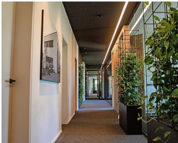
Bilder und Pflanzen lockern die Atmosphäre in den Gängen auf.