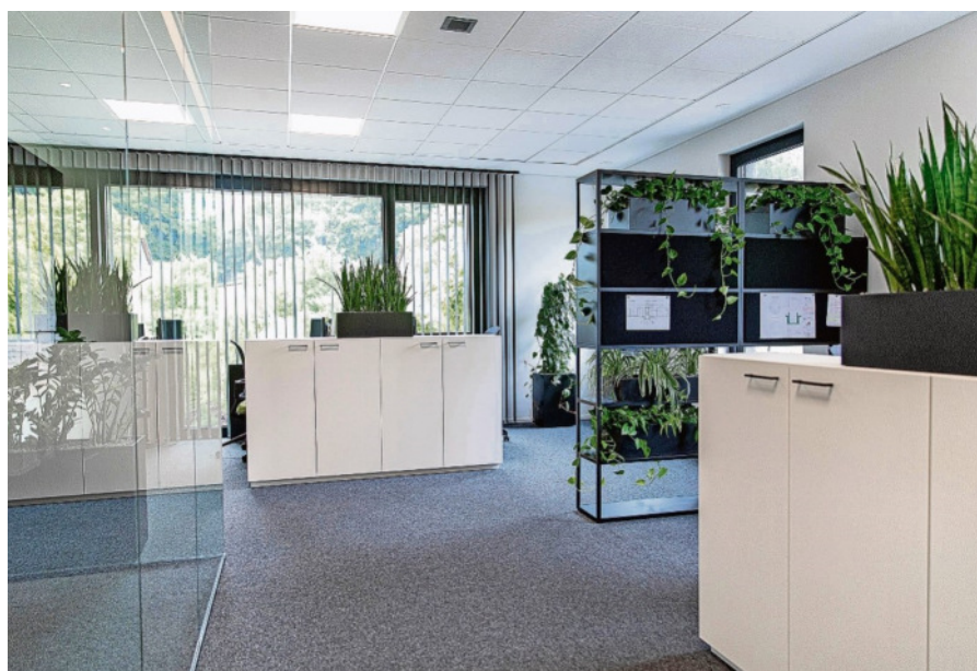
Die Mitarbeiter finden moderne Büroräume vor.

Straßen- und Wegebau sowie die Wasserversorgung gehören ebenfalls zu den Aufgaben wie der Stahlbau und die Ingenieurvermessung, Tragwerksplanung, Bauphysik und Bauwerksprüfung.