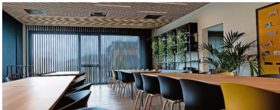
Viel Platz für Gespräche mit Mitarbeitern und Kunden