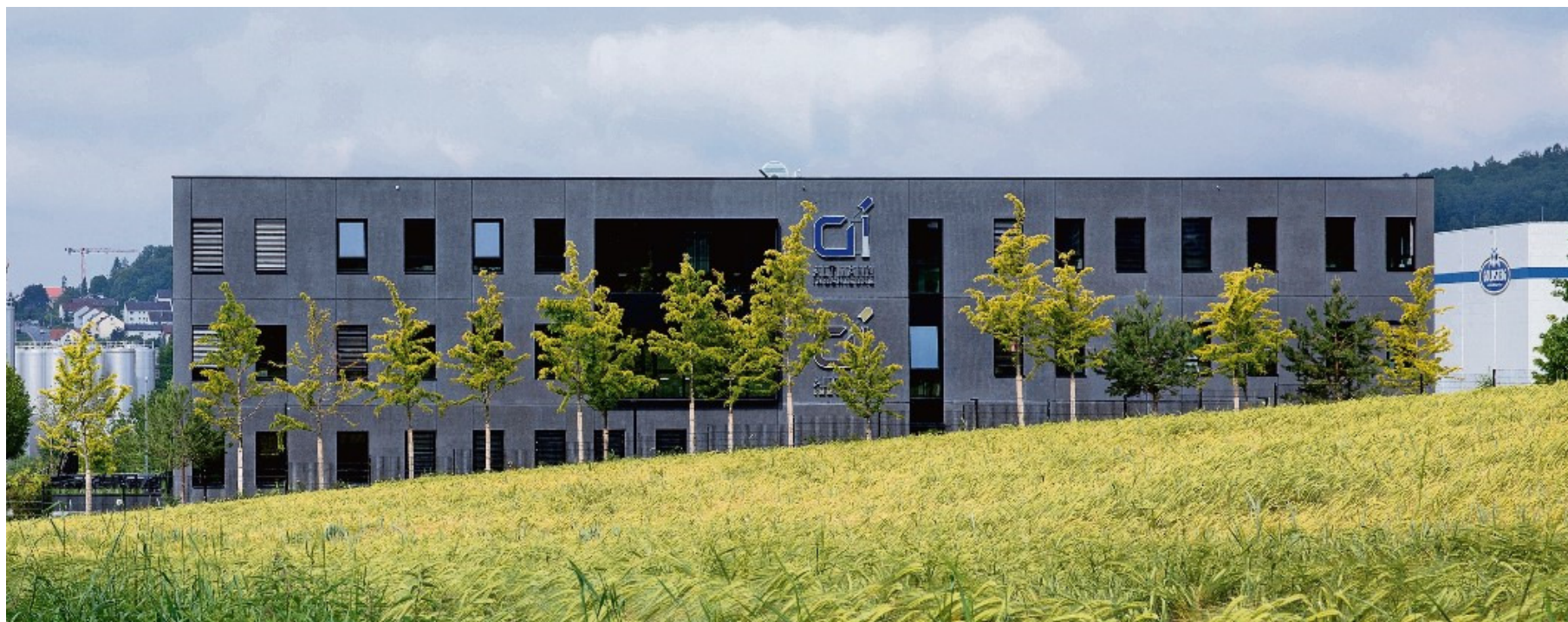
Das neue Firmengebäude punktet mit seiner modernen Fassade.