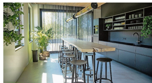
Der Platz für eine kleine Kaffeepause

strukturellen Bewirtschaftung von Wohnungs- und Gewerbeportfolien sowie die Koordination und Steuerung komplexer technischer Baumaßnahmen durch die Bauabteilung.