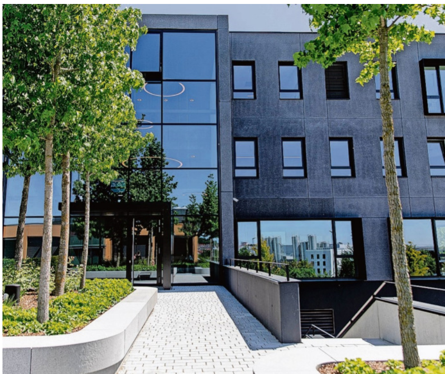
Viel Grün umgibt die neue Firmenzentrale.