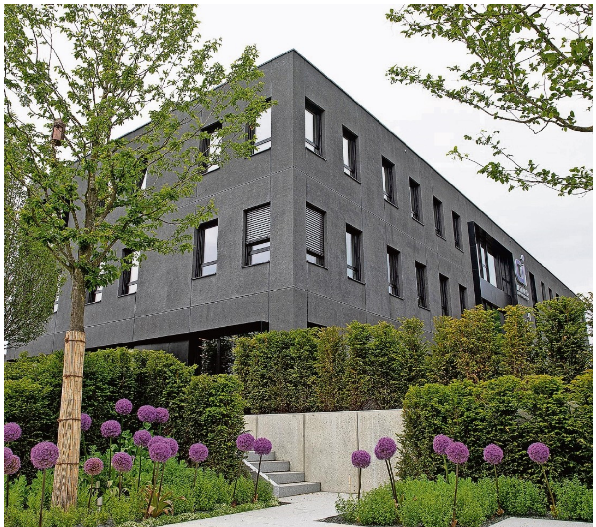
Die neue Firmenzentrale an der St.-Gunther-Straße in Cham