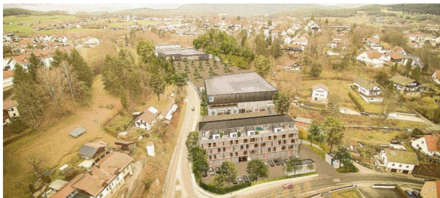
Das ehemalige Aschenbrenner-Areal wird ein Nahversorgungszentrum in Bad Kötzing. Grafik: Altmann

Der Panoramapark in Cham-West ist eine reine Wohnimmobilie. Realisiert wurden unter dem Dach der Altmann & Schierer Projekt GbR (beste-